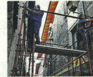
Preparativi. Volontari al lavoro

■ Hanno installato 22 chilometri di tubi per sostenere la grande scenografia