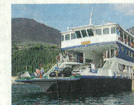
Navigazione. Il traghetto Mincio

■ La metropolitana d'acqua può essere una buona idea e Navigarda la valuterà, ovviamente dopo una richiesta ufficiale. A PAGINA 21